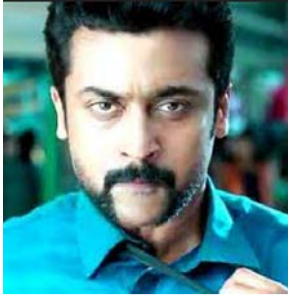
- వివరాలు వెబ్సైట్లో..

సినిమాల్లోనే కాదు.. నిజ జీవితంలోనూ సామాజిక స్పృహ కలిగిన హీరోల్లో ఒకరు సూర్య. ఆ మధ్య నీట్ నిర్వహణపై కోర్టు నిర్ణయాన్ని తప్పబట్టి వార్షికోత్సవం. తాజాగా కేంద్రం సినిమాలోగ్రఫీ చట్టం-1952 సవరించాలని నిర్ణయం తీసుకోవడంపై సూర్య విభేదించారు. చట్టంలో సవరణలు భావ ప్రకటన స్వేచ్ఛకు మరింత మద్దతివ్వాలే కానీ.. దానికి సంకెళ్లే వేసేలా ఉండొద్దని హితవు పలికారు.