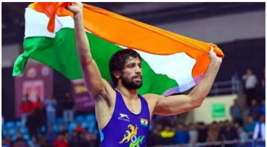
న్యూఢిల్లీ : భారత రెజర్వ్ రవికుమార్ దహియా ఒలింపిక్స్ లో భారత్ కు మరో పతకాన్ని ఖాయం చేశాడు. 57 కిలోల విభాగంలో కజకిస్థాన్ రెజర్వ్ సురిస్టామెత్ జరిగిన పోటీలో 7-9 తేడాతో విజయం సాధించాడు. పైనల్కు చేరుకుని భారత్ ఖాతాలో మరో పతకాన్ని చేర్చేశాడు.