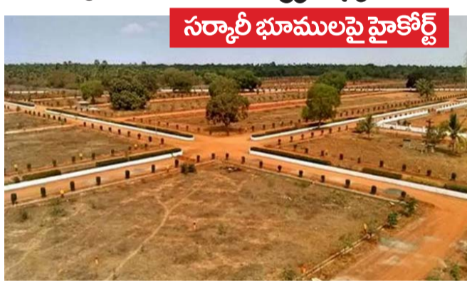
సర్కారీ భూములపై హైకోర్ట్

హైదరాబాద్ ప్రతినీధి, ఆగస్టు 04(తొలి వెలుగు): తెలంగాణలో ప్రభుత్వ భూముల అక్రమణల అంశంపై హైకోర్టు కీలక ఉత్తర్వులు జారీ చేసింది. రాష్ట్రవ్యాప్తంగా సర్వే చేసే ప్రభుత్వ భూములను గుర్తించాలని ఆదేశించింది. చీఫ్ జస్టిస్ హిమ కోహ్లా, జస్టిస్ విజయశేఖర్ రెడ్డి ధర్మాసనం ఈమేరకు ఉత్తర్వులు జారీ చేసింది.