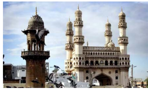
హైదరాబాద్ ప్రతినీధి, ఆగస్టు 04(తొలి వెలుగు): పర్షియా భాగ్యవగరానికి చల్లదనాన్నే కాదు.. స్వచ్ఛమైన గాలిని కూడా అందిస్తున్నాయి. నగరంలో గత నెలలో గాలి నాణ్యతలో గణనీయమైన మెరుగుదల కనిపించింది తెలంగాణ రాష్ట్ర కాలావృత్తి నియంత్రణ మండలి తెలిపింది.