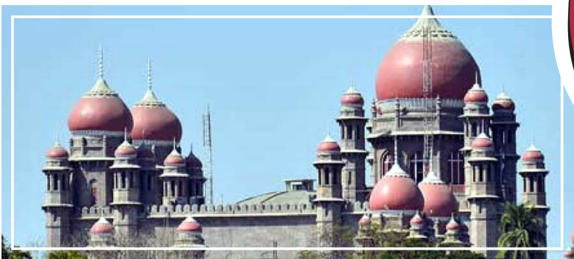
హైదరాబాద్, ఆగస్టు 04(తొలి వెలుగు):