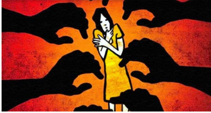
పూర్తి కథనం.. https://tolivelugu.com/