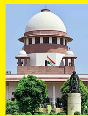
పూర్తి కథనం.. https://tolivelugu.com/

ఢిల్లీ, తొలివెలుగు: జగన్ సర్కార్ కు సుప్రీంకోర్టులో చుక్కెదురైంది. హై కోర్టు ఆదేశాలను అమలు చేయనందుకు సుప్రీం లక్ష రూపాయల జరిమానా విధించింది. దీని సీఫుడ్స్ లిమిటెడ్ కేసులో ఈ జరిమానా పడింది. దీని సీఫుడ్స్ కేసులో ఏపీ ప్రభుత్వం సుప్రీంకోర్టును ఆశ్రయించింది. హైకోర్టు ఆదేశాలను సవాల్ చేసింది. అయితే సుప్రీంలో ప్రభుత్వానికి ఎదురుదెబ్బ తగిలింది. హైకోర్టు ఆదేశాలు అమలు చేయకుండా ధిక్కరణ మినహాయింపు ఇవ్వాలని న్యాయస్థానాన్ని ప్రభుత్వం కోరగా.. విచారణ అనంతరం ఏపీ ప్రభుత్వానికి సుప్రీం కోర్టు లక్ష జరిమానా విధించింది. హైకోర్టు తీర్పును అమలు పర్చాల్సిందేనని కోర్టు స్పష్టం చేసింది.