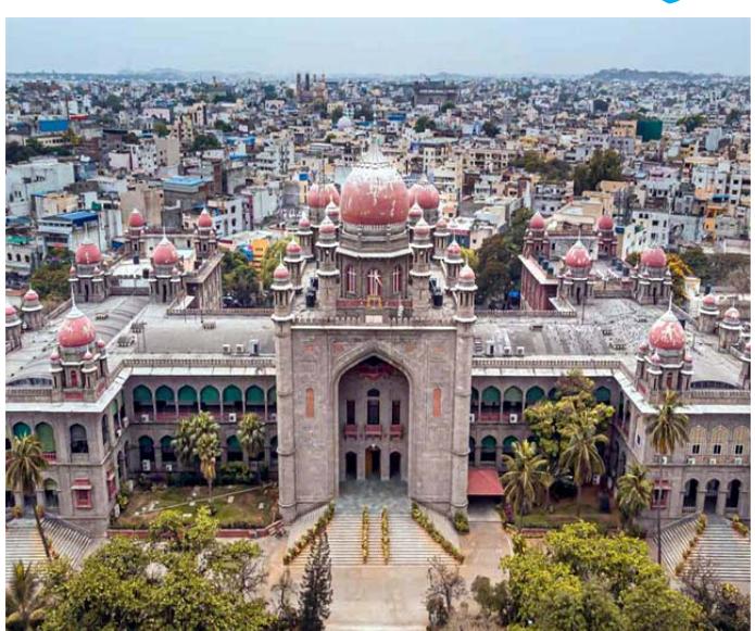
కోర్టుకు తెలిపారు. కేంద్ర ప్రభుత్వం మహిళా పోషన్ అభియాన్ పూర్తి కథనం.. https://tolivelugu.com/

హైదరాబాద్, తొలివెలుగు: దళిత బంధు పిటిషన్ పై హైకోర్టులో వాదనలు ముగిసాయి. అయితే తీర్పును మాత్రం హైకోర్టు రిజర్వ్ లో పెట్టింది. దళిత బంధును ఎన్నికల సంఘం ఆపడాన్ని సవాల్ చేస్తూ నాలుగు పిటిషన్లు దాఖలు కాగా, ఎన్నికల నోటిఫికేషన్ రాకముందే తెలంగాణ రాష్ట్రంలో దళిత బంధు పథకం అమలవుతుందని పిటిషనర్లు పేర్కొన్నారు. ఒక్క మజూరాబాద్ లోనే దళిత బంధు పథకం అమలు కావడం లేదని పిటిషనర్లు తెలిపారు. రాష్ట్రంలో ఉన్నటువంటి అన్ని జిల్లాల్లో అమలవుతుందని