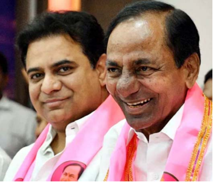
పూర్తి కథనం.. https://tolivelugu.com/

హైదరాబాద్, తొలివెలుగు: టీఆర్ఎస్ పాలన దేశానికే ఆదర్శ మంటూ ప్లీనరీ వేదిక కేసీఆర్ చేసిన వ్యాఖ్యలపై కొంటర్ఎటాక్ చేశారు టీపీసీసీ చీఫ్ రేవంత్ రెడ్డి. టీఆర్ఎస్ 20 ఏళ్లు పూర్తి చేసుకుందని ఆ పార్టీ నేతలు సంబరాలు చేసుకుంటున్నారన్న ఆయన.. ఉద్యమ ముసుగులో శవాల మీద గులాబీ పార్టీని విస్తరించారని ఆరోపించారు. కేసీఆర్, కేటీఆర్ ఇద్దరి బొమ్మలే ప్లీనరీలో పెట్టుకున్నారు.. తెలంగాణ అమర వీరులను స్మరించుకోలేదని మండిపడ్డారు.