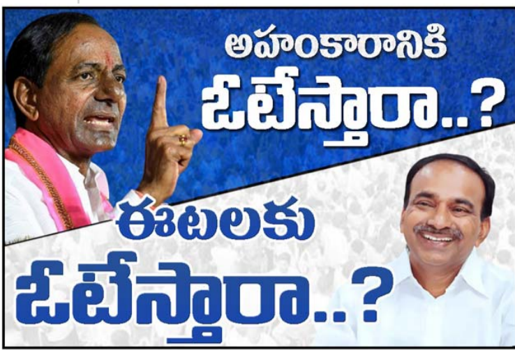
పైదరాబాద్ తలుగు డిజిటల్ న్యూస్ పేపర్ (కాంప్లిమెంటరీ కాపీ)

ముంబై, తొలివెలుగు: అక్టోబర్ 17 నుంచి టీ20 వరల్డ్ కప్ మ్యాచ్లు జరగనున్నాయి. ఈ నేపథ్యంలోనే టీమిండియా స్టూ జెర్నీని లాంచ్ చేసింది. సరికొత్త జెర్నీలో ఆటగాళ్లు తళుక్కుమన్నారు. టీమిండియాకుకి స్పాన్సర్ అయిన ఎంపీఎల్ స్పోర్ట్స్ నూతన జెర్నీని ఆవిష్కరించింది. ఇది డార్ట్ బ్లూ కలర్లో ఉంది. పూర్తి కథనం.. https://tolivelugu.com/