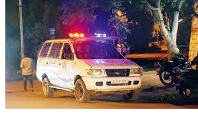
పూర్తి కథనం.. https://tolivelugu.com/