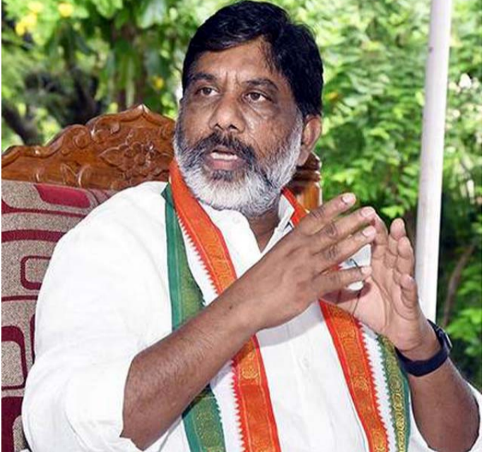
చెప్పిన భట్టి ప్రజలు ఆలోచించి ఓటు వేయాలని విజ్ఞప్తి చేశారు. https://tolivelugu.com/

హుజూరాబాద్ ఉప ఎన్నిక ప్రచారంలో కాంగ్రెస్ నేతలు దూకుడు పెంచారు. బీజేపీ, టీఆర్ఎస్ పై ఘాటైన విమర్శలతో విరుచుకు పడుతున్నారు. హుజూరాబాద్ రూరల్ మండలం కనుకలగిద్ద గ్రామం లో ఎన్నికల ప్రచారం నిర్వహించిన భట్టి.. కేసీఆర్, ఈటల పై నిప్పులు చెరిగారు. కేసీఆర్ ను పెద్దదొంగ.. ఈటలను చిన్నదొంగగా అభివర్ణించిన ఆయన.. ఇద్దరికీ గట్టి బుద్ధి చెప్పాలని ఓటర్లను కోరారు. తెలంగాణ వనరులు దోచుకున్న దొంగలు ఒకవైపు.. సామాజిక సమతుల్యత కోసం రాష్ట్రాన్ని ప్రసాదించిన కాంగ్రెస్ మరోవైపు ఉన్నాయని