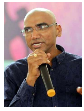
ఎగరవేయాలని పిలుపునిచ్చారు. బహుజన రాజ్య ప్రతిష్ఠాపన కోసం యువత కలిసి రావాలని ఢిల్లీలో చేశారు ఆర్ఎస్పీ. పూర్తి కథనం.. https://tolivelugu.com/

పత్తి, మిర్చి బస్తాలు మోయాల్సిన పరిస్థితి విద్యార్థులకు పట్టించిన పాపం సీఎంకు తగులుతుందని అన్నారు. కేసీఆర్ ప్రభుత్వంలో ఇంతకన్నా ఎక్కువ మనకు ఏం ఒరగదని ఎద్దేవా చేశారు. ఇటువంటి పరిస్థితులు మారాలంటే బహుజన పార్టీ అధికారంలోకి రావాలని అన్నారు. బహుజన రాజ్య స్థాపనలో ప్రతిఒక్కరు భాగస్వాములు కావాలని యువతకు పిలుపునిచ్చారు. కేసీఆర్ ప్రభుత్వంలో నిరుద్యోగులకు నిరీక్షణ తప్పట్లేదని మండిపడ్డారు. మన బంగారు భవిష్యత్తును మనమే నిర్మించుకోవాలని అన్నారు ఆర్ఎస్పీ రాష్ట్రవ్యాప్తంగా గ్రామగ్రామాన నీలి జెండాను